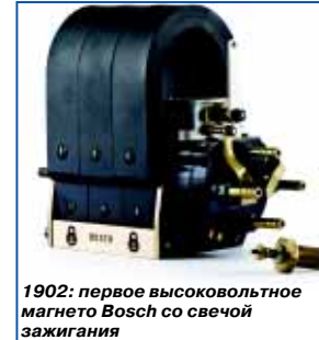
1902: первое высоковольтное магнето Bosch со свечной зажиганием