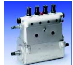
1927: первый серийный дизельный насос высокого давления

1927 г. – топливный насос высокого давления для дизельных двигателей. Хотя Роберт Бош его не изобрел, а лишь усовершенствовал. Но это усовершенствование по-настоящему открыло эпоху дизельных авто: использование гидравлического устройства позволило отказаться от громоздкого