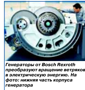
Генераторы от Bosch Rexroth преобразуют вращение ветряков в электрическую энергию. На фото: нижняя часть корпуса генератора

На основе созданного в 1932 подразделения специального машиностроения для собственных нужд, в 1974 году у фирмы появи-