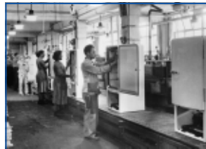
1952: конвейер по сбору холодильников на заводе Bosch