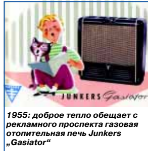
1955: доброе тепло обещает с рекламной проспекта газовая отопительная печь Junkers „Gasiator“

В 1956 Bosch со слоганом «Свежесть, доступная в любое время» анонсирует свою первую морозильную камеру. В этом же году уже миллионный домашний холодильник покидает конвейер.